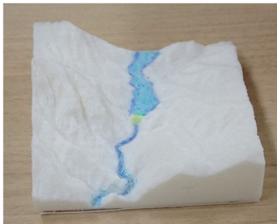
⑤ 黒部峡谷とダム