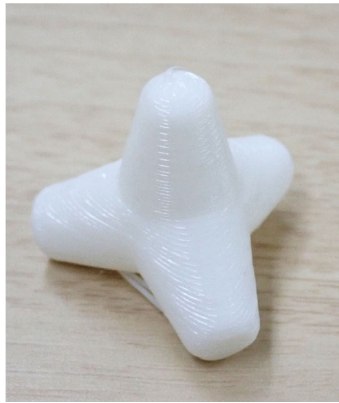
③ テトラポット (研究部 石田聡史 出向元:大林組)